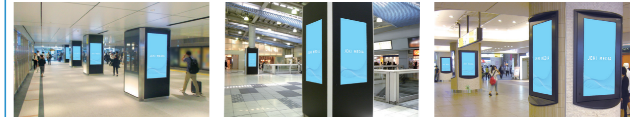
東京駅丸の内地下連絡通路

J・ADビジョン 縦型のデジタルサイネージで、駅コンコースや通路の流動スペースに、原則複数面を設置しています。