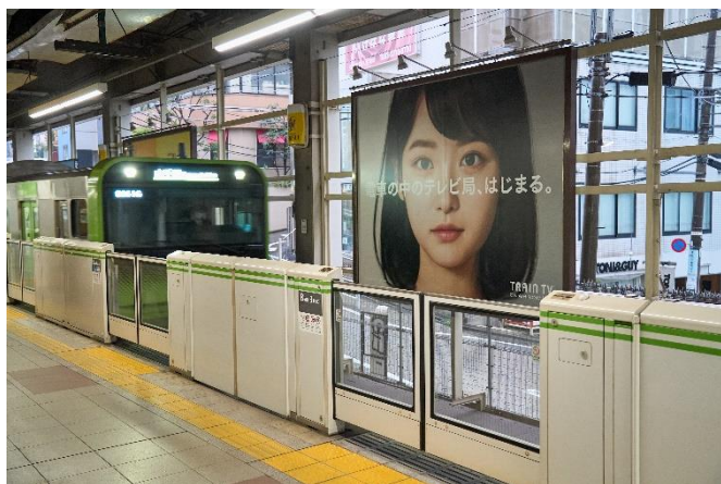
大型サインボード

週にのべ8,400万人(jeki調べ)に情報をお届けしているJR東日本の車内モニターは、広告中心の編成を番組中心へ刷新。新しい時代の生活密着メディアとして、より便利に、より楽しく生まれ変わります。