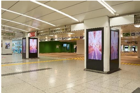
デジタルサイネージ

4月1日以降、「TRAIN TV」開局を記念し、首都圏JR主要路線の中ぶり・まど上ポスター・車内モニター・山手線車体広告や、主要駅のポスター・デジタルサイネージ・大型サインボードにて、大規模なプロモーションを展開します。