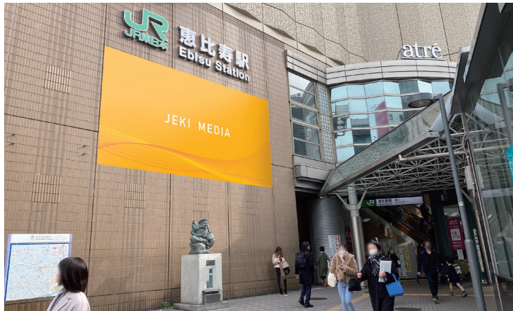
〈掲出位置〉 恵比寿駅