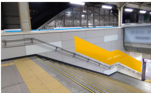
A 【3番線階段側(有楽町方)】