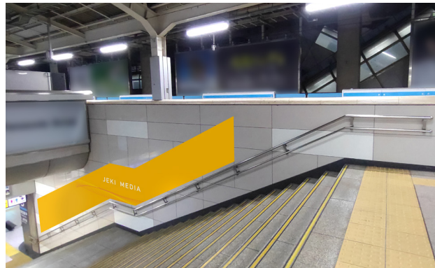
B 【3番線階段側(神田方)】