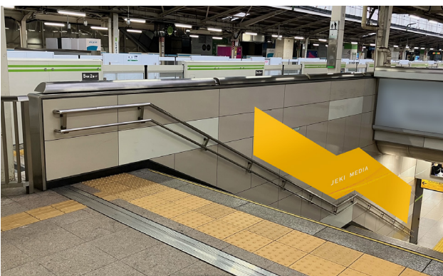
C 【5番線階段側(有楽町方)】