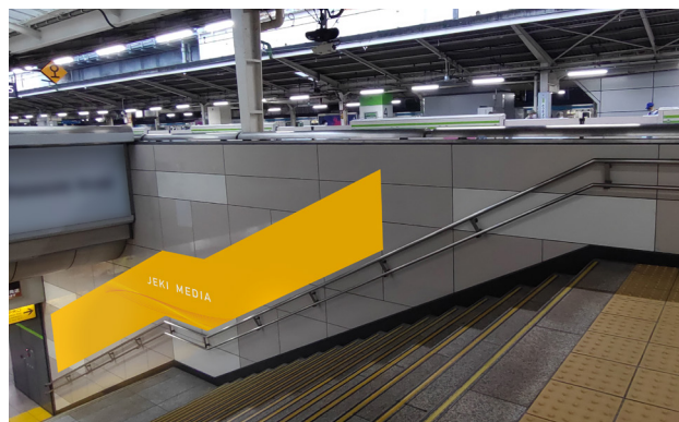
D 【5番線階段側(神田方)】