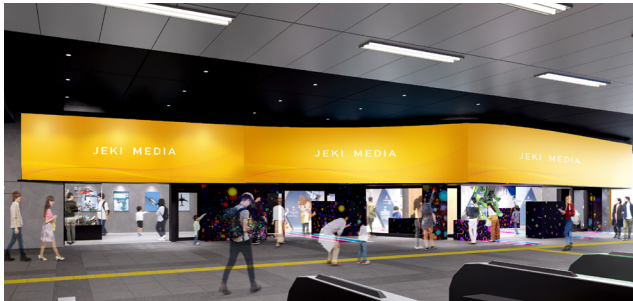
サイネージ・ショールーミングスペース