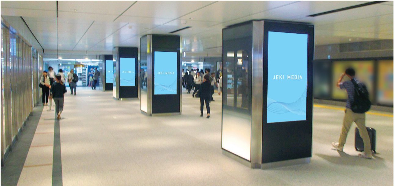
東京駅丸の内地下連絡通路