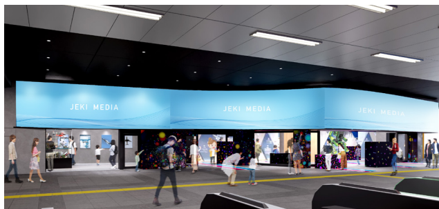
サイネージ・ショールーミングスペース