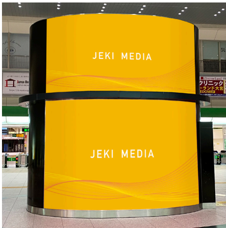
大宮中央改札外正面(北)シート