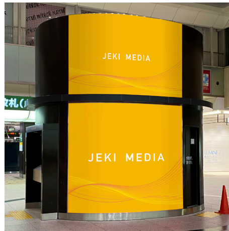
大宮中央改札外正面(南)シート

※断面図(青線部分の「ひさし」は全周にあります) ※意匠サイズは、有効意匠掲出範囲