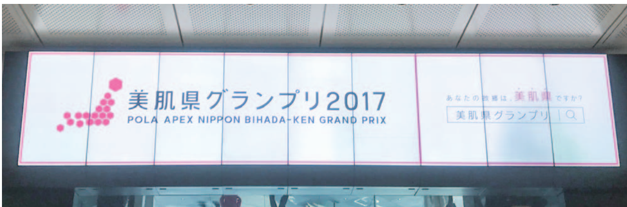
丸の内南北ドーム