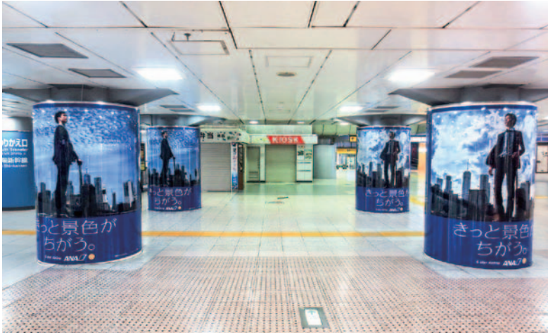
東京駅八重洲南口コンコースアドピラー