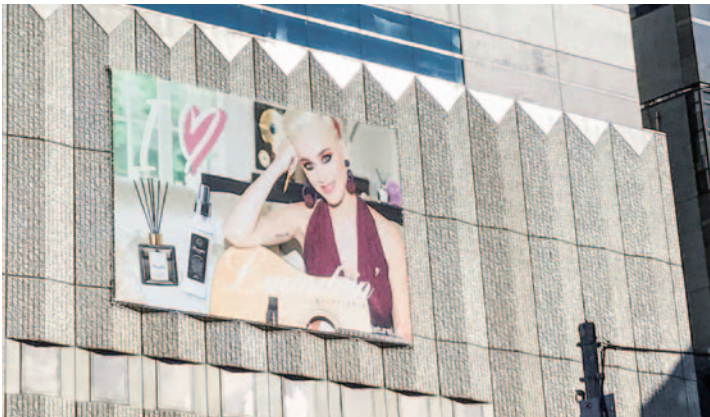
〈掲出位置〉 恵比寿駅