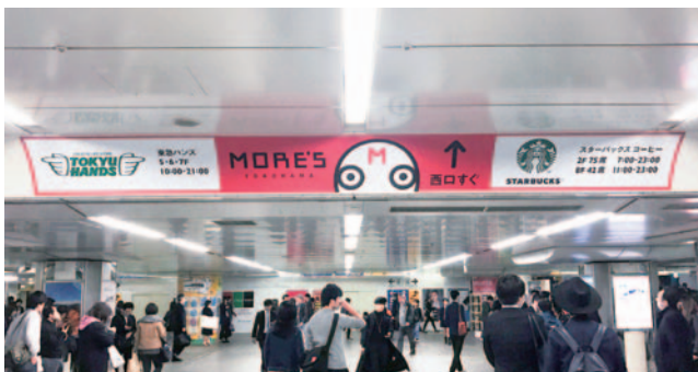
横浜ラウンドシート A