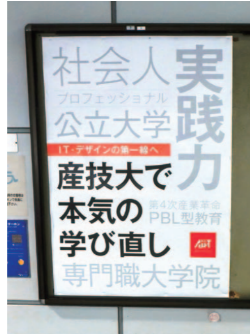
ゆりかもめ新橋駅