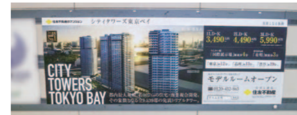
東京テレポート駅