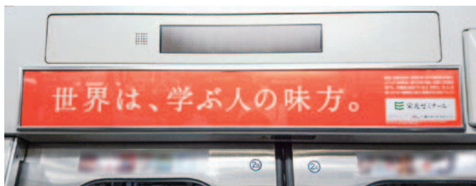
ドア上(ペーパーラジオ)

〈媒体サイズ〉 クワエ ※この部分はホルダーに隠れる部分ですのでご注意ください。