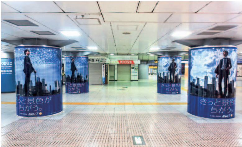
東京駅八重洲南口コンコースアドピラー