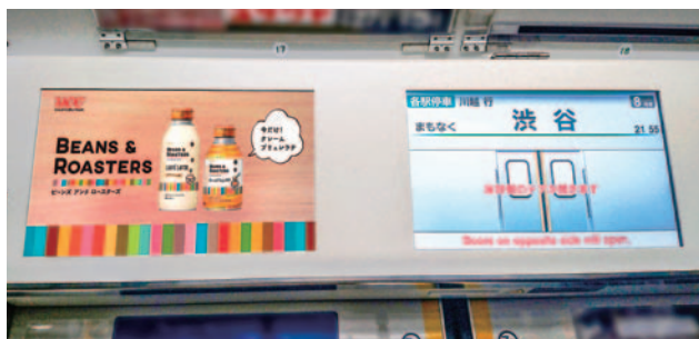
JR東日本 トレインチャンネル

東京を中心とする首都圏のトレインチャンネルと、大阪を中心とする関西圏のWESTビジョンをセットにした商品です。 新型車両数が増え、ますますネットワークが充実しました。