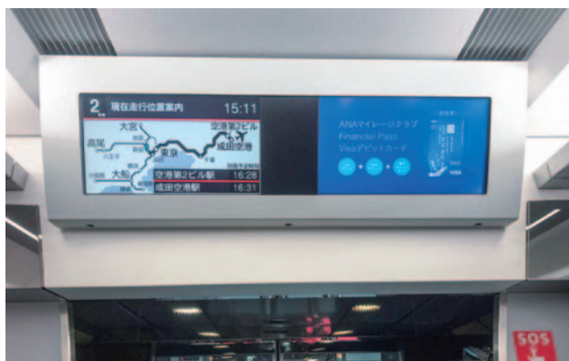
N'EXトレインチャンネル

ニュース、天気予報、フライト情報(下り東京～成田空港間のみ)等のN'EXを利用するお客さま向け必須情報とともに放映することで、より高い注目率の獲得が期待できます。