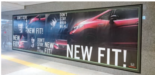
パノラマネットワークセット東京駅(7月3日~7月9日)