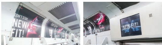
山手線ADトレイン(E231系)