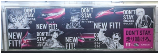
パノラマネットワークセット新宿駅(7月17日~7月23日)