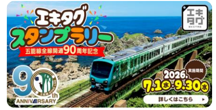
専用スタンプ帳のラベル