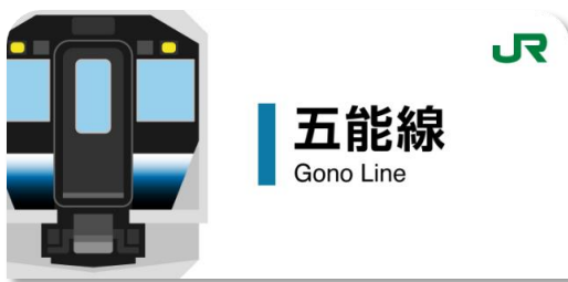
五能線のスタンプ帳ラベル