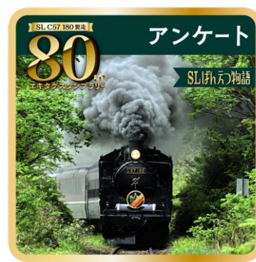
アンケートスタンプ