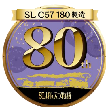
C57 180 傘寿限定スタンプ