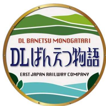
DL ばんえつ物語限定スタンプ