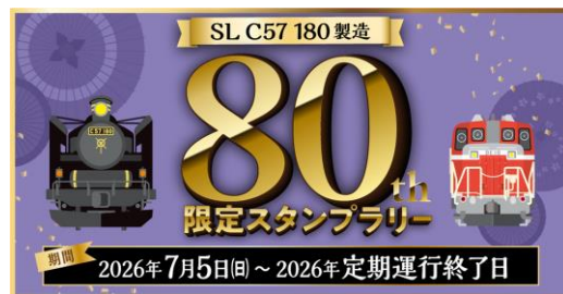
専用スタンプ帳ラベル

アンケートスタンプ（アプリ内回答で自動付与）の3種類すべてを取得すると自動付与。