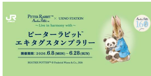
専用スタンプ帳のラベル

https://media.jreast.co.jp/articles/6203