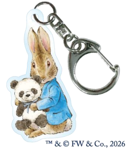
『ピーターラビット™エキタグスタンプラリー』 スタンプデザイン（一部）