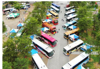
過去のバスマつりの様子