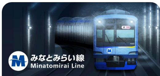
みなとみらい線のスタンプ帳ラベル