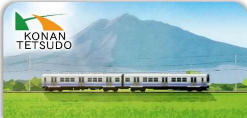
弘南鉄道のスタンプ帳ラベル