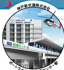
医療センター駅 (限定デザイン)