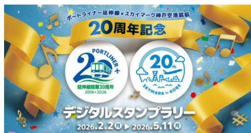
専用スタンプ帳のラベル