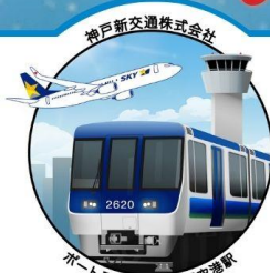
神戸空港駅 (限定デザイン)