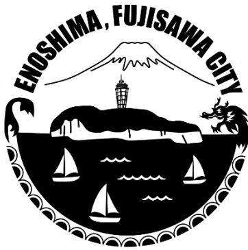
藤沢市観光センターオリジナルスタンプ