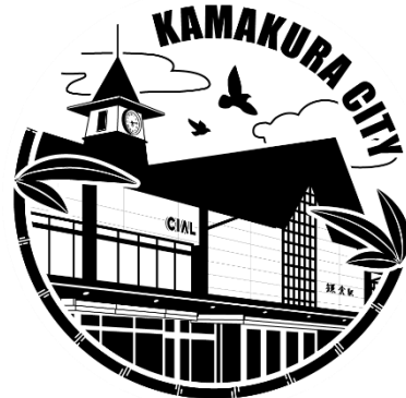
鎌倉市観光案内所オリジナルスタンプ