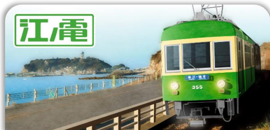
江ノ島電鉄スタンプ帳ラベル