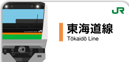
東海道線スタンプ帳ラベル