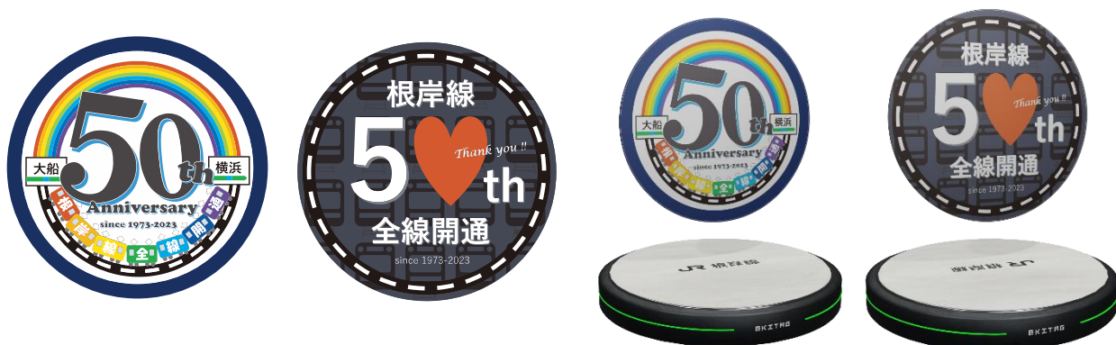
左から 8 駅達成記念スタンプ、12 駅コンプリート記念スタンプ、オリジナル NFT (表と裏)

( https://www.jreast.co.jp/press/2023/yokohama/20240216_y02.pdf ) をご確認ください。