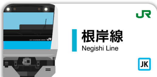
根岸線スタンプ帳ラベル