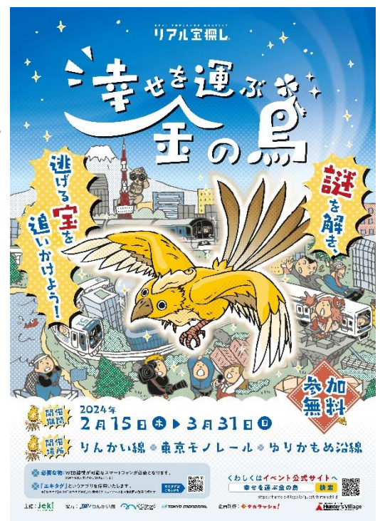
【ポスターイメージ】

本企画の内容については「タカラッシュ」が運営する「ハンターズヴィレッジ」( https://huntersvillage.jp/ )にて掲載いたします。(2月1日(木)14時オープン予定)