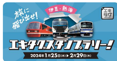
キャンペーンバナー

②ゴール対象駅の各ゾーンのスタンプを1つ以上取得するとゾーンに応じた記念スタンプをプレゼントします。さらに抽選で各ゾーン10名さまに各社オリジナルヘッドマーク NFT をプレゼントします。