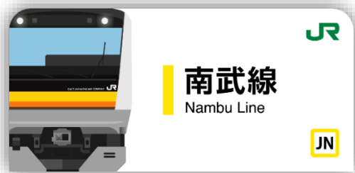
南武線スタンプ帳ラベル