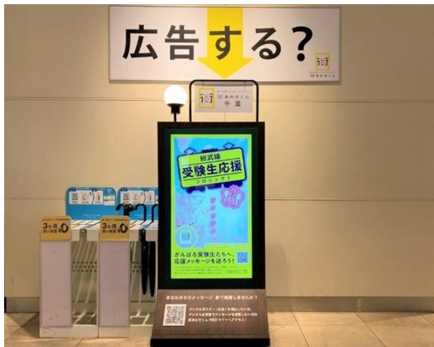
受験生応援プロジェクト共通デザイン（千葉駅）

株式会社ジェイアール東日本企画千葉支社（千葉市中央区、以下 jeki 千葉支社）は、地域の受験生を応援するために「総武線受験生応援プロジェクト」をスタートしました。