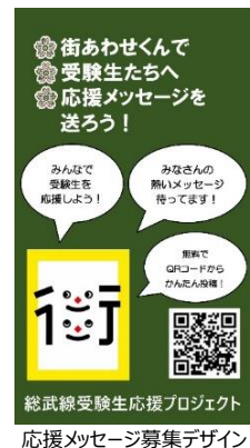
応援メッセージ募集デザイン

第1弾として jeki 千葉支社から、伝言板への応援メッセージを募集する画像を掲出しています。