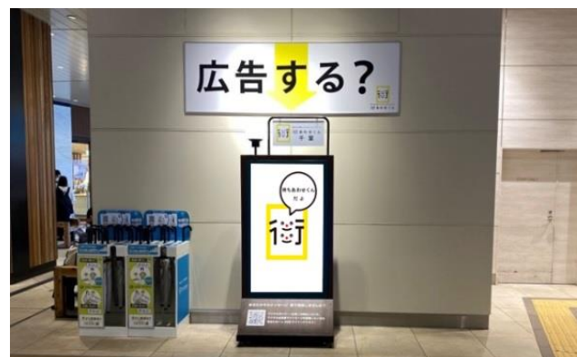
「街あわせくん」千葉駅

2022年9月1日よりサービスを開始し、現在、総武線沿線の以下のJR5駅に設置されています。千葉駅・市川駅・小岩駅・亀戸駅・錦糸町駅