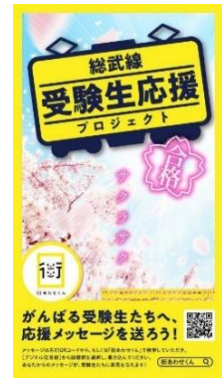
受験生応援共通デザイン

総武線カラーである黄色をベースに鉄道のイラストを配置したほか、合格を意味する「サクサク」の言葉や桜の画像を取り入れ、一目で「受験」「合格」がイメージできる内容としました。千葉駅・市川駅・小岩駅・亀戸駅・錦糸町駅の各 JR 駅に掲出しています。