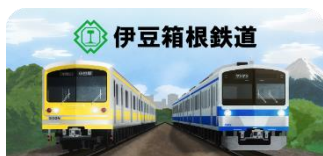
スタンプ帳ラベル