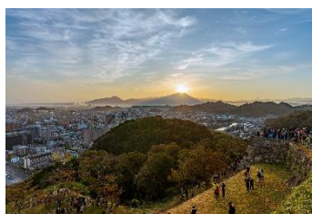
米子城からのダイヤモンド大山