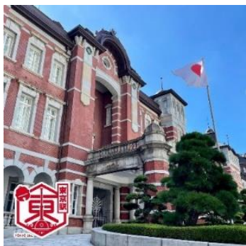
▲スタンプ活用機能例(東京駅)