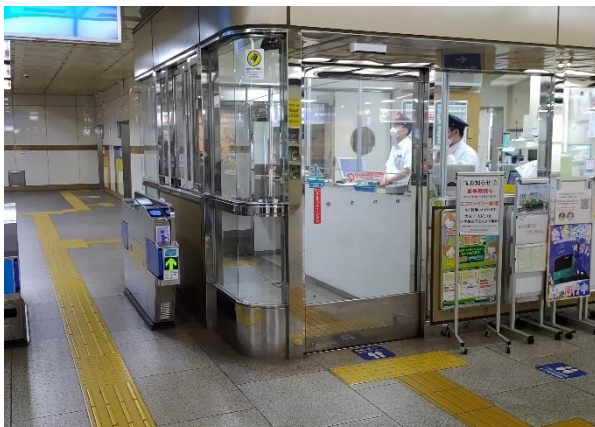
【地下鉄三宮駅東改札口】

事前にベビカル専用ウェブサイトでご予約のうえ、三宮駅東改札口駅窓口でお申し出いただきご利用いただけます。