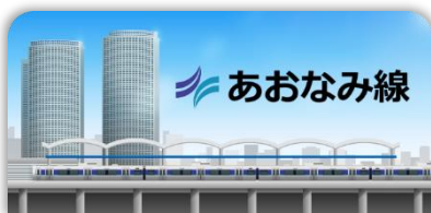
あおなみ線 スタンプ帳ラベル