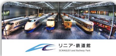
リニア・鉄道館 スタンプ帳ラベル

エキタグのデジタルスタンプ設置箇所にはNFCタグのサインを掲出します。デジタルスタンプの取得時間、取得場所は、アプリ内スタンプ帳の「i」マークをタップしてご確認いただけます。