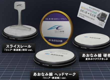
スライスレール 「リニア・鉄道館」刷印 ver.