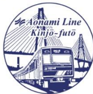
あおなみ線 金城ふ頭駅