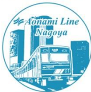
あおなみ線 名古屋駅