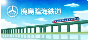
鹿島臨海鉄道スタンプ帳ラベル