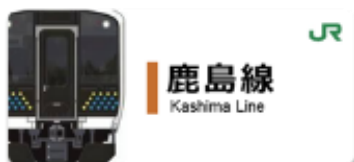
鹿島線スタンプ帳ラベル