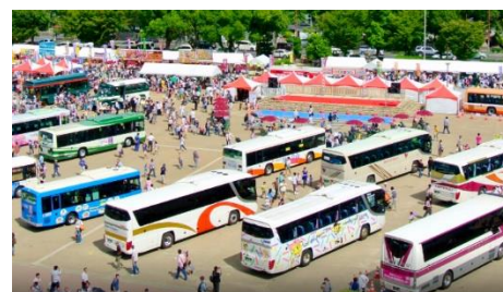
過去のバスマつりの様子

今後も、多くのお客さまに鉄道でのお出かけを楽しんでいただけるよう、鉄道事業者との連携により対応路線の拡大に取り組んで参ります。