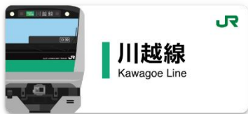
川越線スタンプ帳ラベル

デジタルスタンプ設置駅には NFC タグのサインを掲出いたします。設置スタンプの取得時間、取得場所は、アプリ内スタンプ帳の各駅の「i」マークをタップし、ご確認ください。