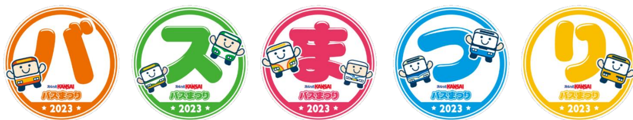
チェックポイントのスタンプ (5箇所)

会場内に設置したチェックポイントでスタンプを獲得するとゴール地点でノベルティをプレゼントいたします。