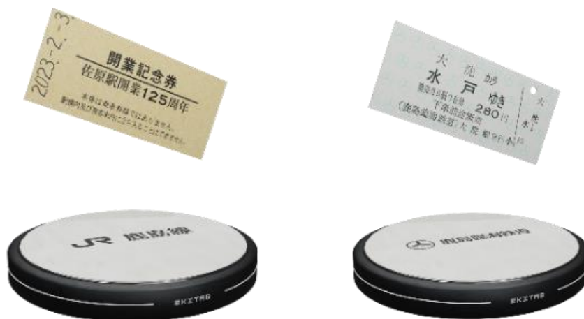
オリジナル硬券 NFT のラインナップ

特典1 で限定スタンプを獲得されたお客さまに抽選で NFT コンテンツ 2 種を合計 20 名様にプレゼント。