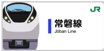
常磐線スタンプ帳ラベル