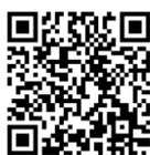
ダウンロード用 QR コード