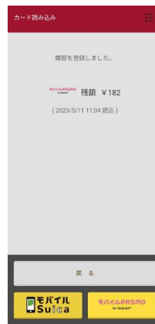
読み取り結果画面