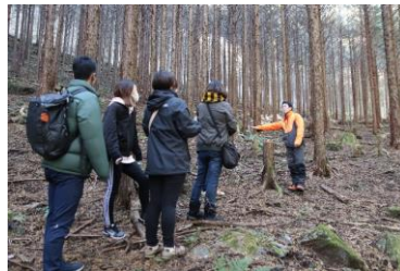
森林ガイドウォーク