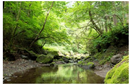
奥多摩町・海沢地区