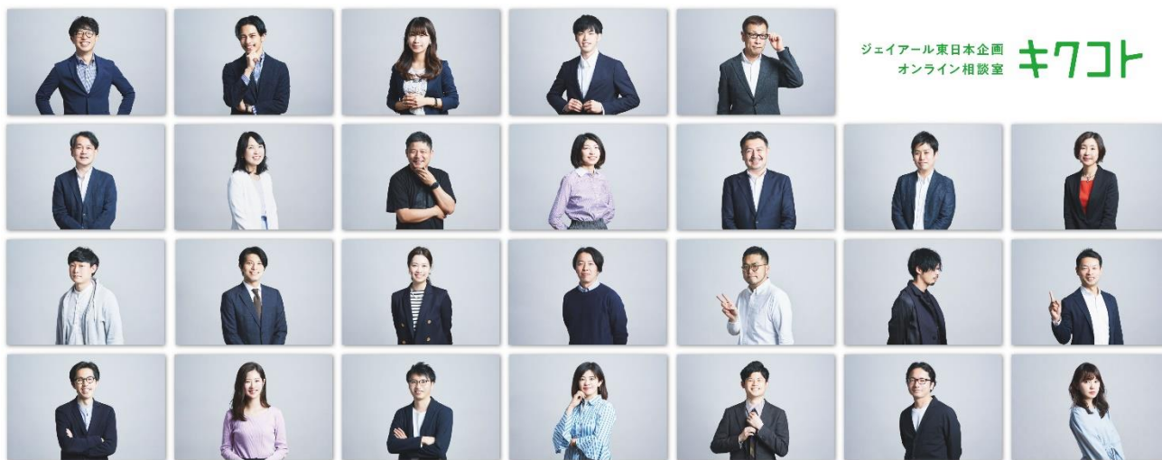
※専属相談パートナー&専門スタッフ

様々な実績・経験を持つ当社社員を本サービスの専属相談パートナーとして配置し、オンライン中心だからこそできるスピード感のある対応でクライアントビジネスの成功に伴走していきます。また、クリエイティブ、マーケティング、デジタル、メディアなど各分野の専門性の高いスタッフも加わり、クオリティの高い対応を提供します。