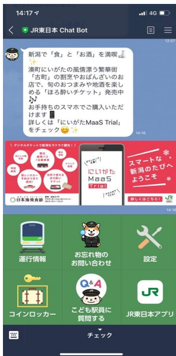
新潟駅構内で受信するメッセージのイメージ

にいがた MaaS Trial では、東京都内の対象駅・車両 Beacon 及び新潟駅構内に設置された Beacon から、受信したお客さまへサービスのご案内をお届けします。山手線では新潟への旅行をおすすめし、新潟ではおもてなしのメッセージでユーザをお迎えします。