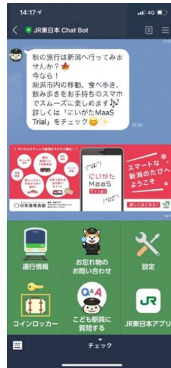
東京都内の対象駅・車両で受信するメッセージのイメージ