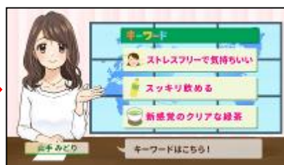
ニュースリリースから(株)共同通信社が効果的なキーワードを抜粋して紹介