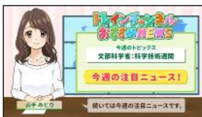
今週のトピックスを紹介