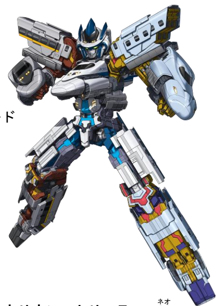
シンカリオン トリニティー ネオ N