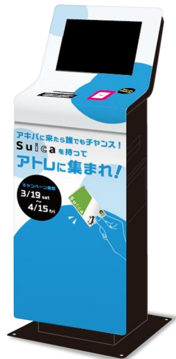
※画像はイメージです。細部は変更になる場合がございます。