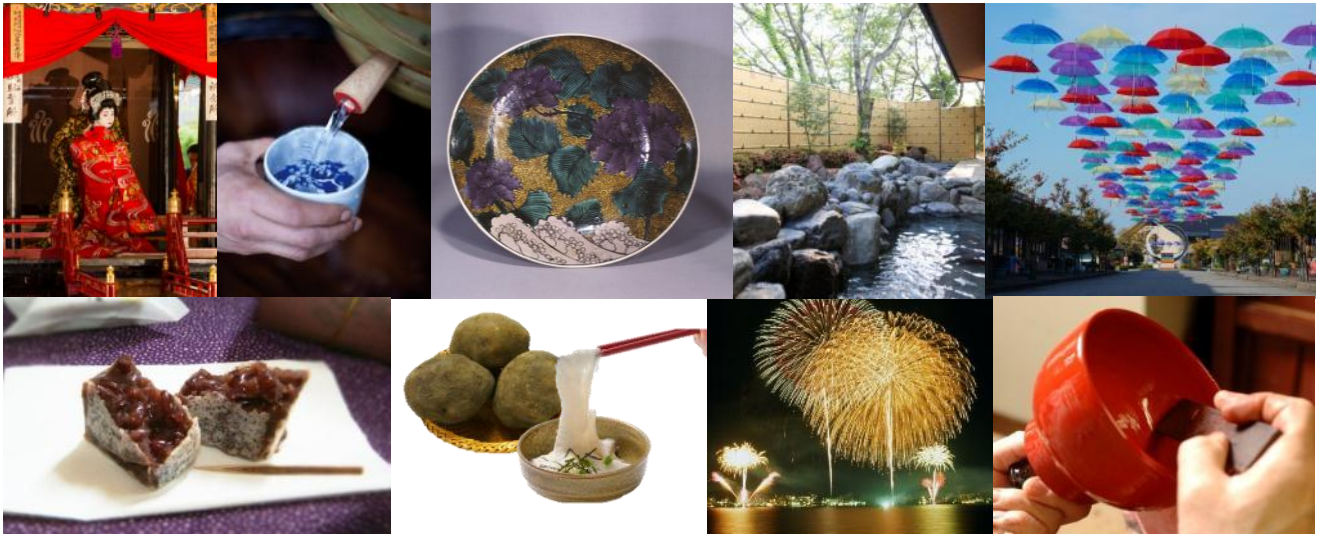
※写真は全てイメージです。