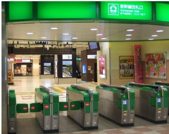
高崎駅新幹線改札