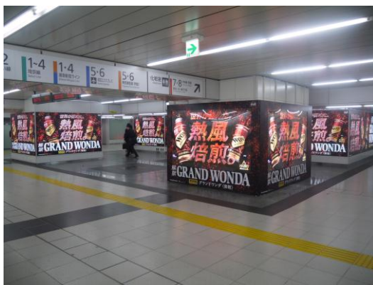
新宿駅アルプス広場電照シートセット