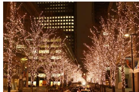
2012年度のイルミネーション

[場所] 丸の内仲通り (ほか) [お問い合わせ]丸の内コールセンター03-5218-5100