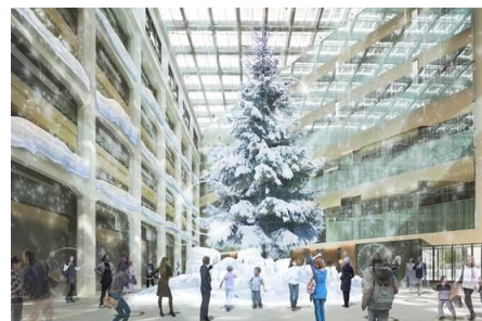
1Fアトリウム クリスマスツリーイメージ

[場所] KITTE館内各フロア、1Fテラス [お問い合わせ]KITTEインフォメーションセンター 03-3216-2811 (10:00～19:00)