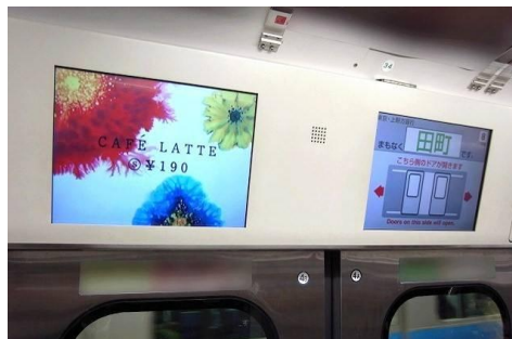
《トレインチャンネル》