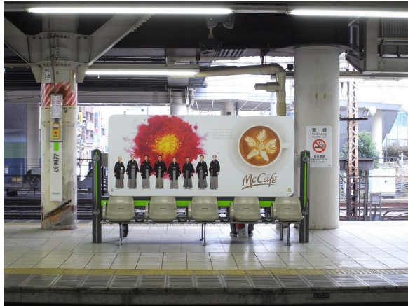
《JR田町駅:ベンチサインボード》