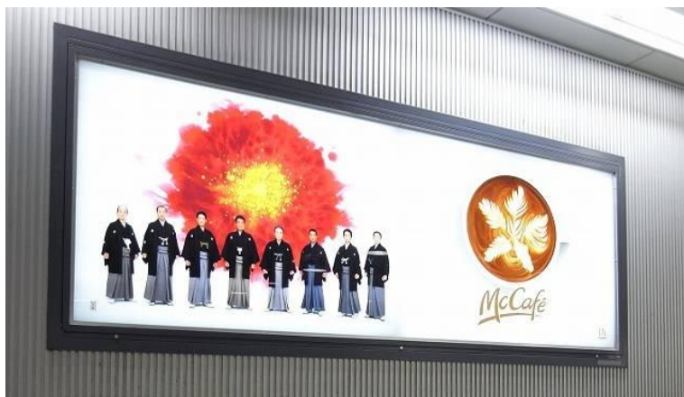
《JR大崎駅: サインボード》