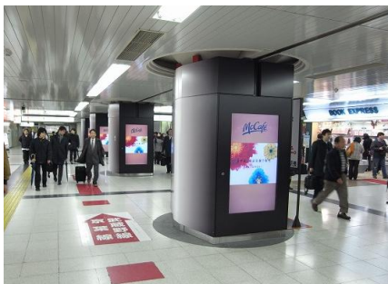
《JR東京駅:デジタルポスター》