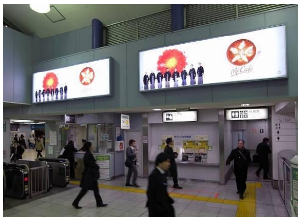
《JR田町駅: サインボード》