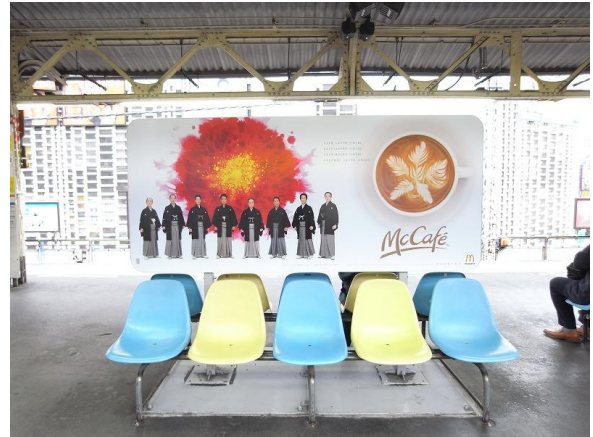
《JR新橋駅:ベンチサインボード》