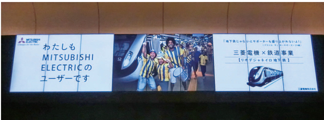
丸の内南北ドーム