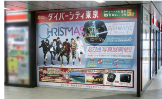
「ゆりかもめ」新橋シートA