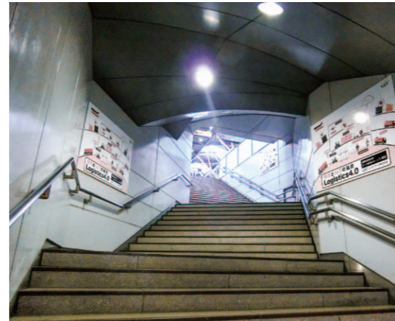
「ゆりかもめ」集中貼り