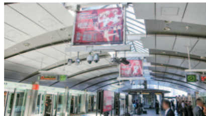
「ゆりかもめ」新橋ホームフラッグ